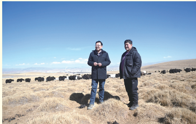
2023年2月24日，在青海省海北藏族自治州海晏县青海湖乡达玉日秀村，全国人大代表董全民（左）查看牧民东知布家的草场。

把党的主张和人民的意志通过法定程序转化为国家意志，决定重大事项、保障国家发展……人民代表大会肩负重任、使命光荣，“中国之治”迈入新境界。