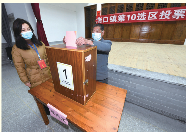
2021年12月14日，在浙江省杭州市临安区湍口镇迎丰村的基层投票点，村民在参加投票，村级监察联络员监票。

选举人大代表，是人民代表大会制度的基础。习近平总书记明确指出，要加强选举全过程监督，坚决查处选举中的不正之风，确保选举作风清正，确