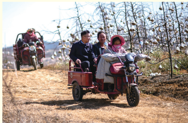
全国人大代表海波（右三）在云南省曲靖市马龙区一种植基地了解务工人员就业需求（2023年2月11日摄）。

“有基层一线的同志当人大代表，是我国人民代表大会制度的政治优势。”2017年全国人代会期间，习近平总书记同代表交流时道出了人民民主的真谛。