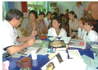
2006年7月，外国学员来到金庚康复医院进修学习中医诊疗方法。

诵了很多人体穴位名称，但亲自给病人扎针还是第一次，感觉很奇妙，还要多加练习。如此神奇的针灸技术，在欧洲是难以学到的。”