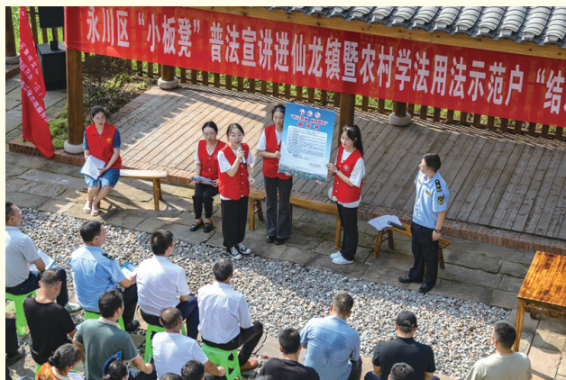
2023年7月10日，在重庆市永川区仙龙镇双星村，“小板凳”宣讲队员在为村民宣讲长江十年禁渔相关知识。新华社记者 黄伟 摄

习近平总书记强调，“要用好宪法赋予人大的监督权，实行正确监督、有效监督、依法监督”“要更好发挥人大监督在党和国家监督体系中的重要作用”。