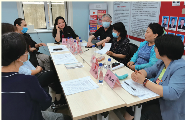
北京市东城区景山街道人大代表之家（资料照片）。

多地推行民生实事项目人大代表票决制，广泛设立代表之家、代表联络站倾听基层声音……一项项更丰富、更接地气的民主实践，充分发挥人民代表大会制度特点与优势，让人民群众成为改革发展的建议者、决策者、监督者和最终受益人者。