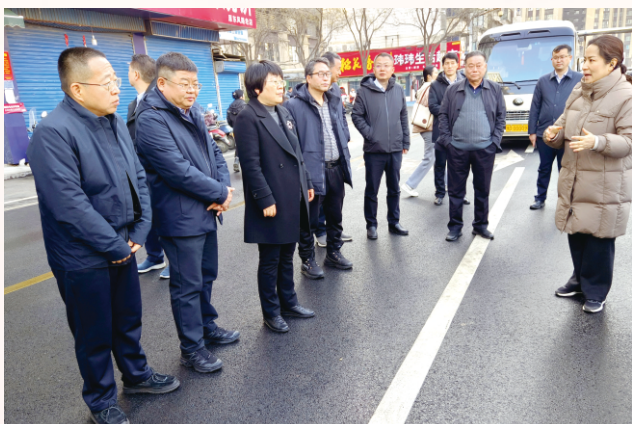
12月31日，市人大常委会副主任李玉洁带队调研城市道路建设及城市更新工作