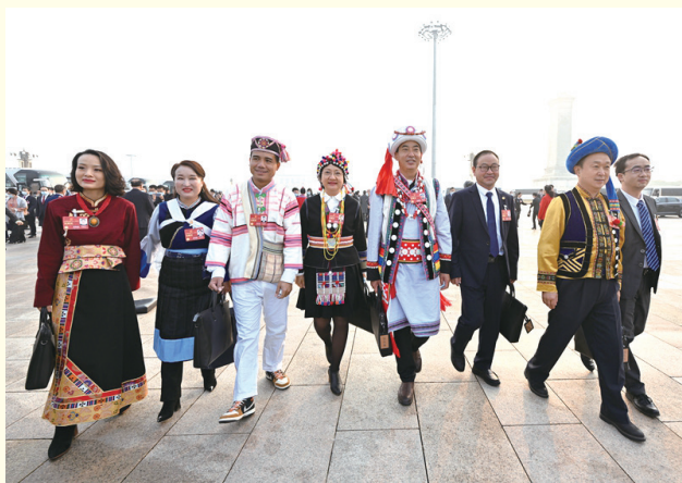
2023年3月5日，第十四届全国人民代表大会第一次会议在北京人民大会堂开幕。这是全国人大代表走向会场。新华社记者 陈益宸 摄

实现城乡按相同人口比例选举人大代表，改革开放以来进行12次乡级人大代表直接选举、11次县级人大代表直接选举；