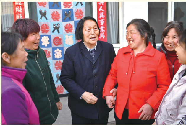
2019年3月23日，申纪兰（左三）在山西省平顺县西沟村与村民分享全国两会精神。

1954年，这里走出一位25岁的全国人大代表——申纪兰。此后几十年，她连续十三届当选了全国人大代表。