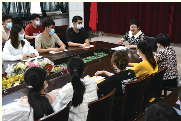
2020年6月16日，在山东潍坊学院法学院，全国人大代表高明芹在宣讲《民法典》相关内容。

全国人大常委会会议10次审议，10次向社会公开征求意见，3次组织全国人大代表研读讨论，针对意见反映集中、争议较大的问题专门召开座谈会……民法典编纂历时5年，成为全国人大及其常委会开门立法、民主立法的生动写照。