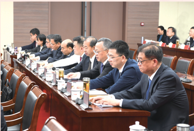
常委会组成人员按键表决相关事项