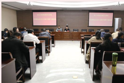
10月18日，市委党校陶心怡老师 到市人大常委会机关讲授社会主义核心价值观 相关知识