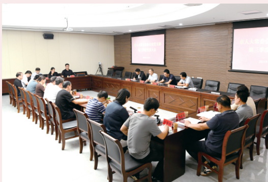
9月20日，市人大常委会机关办公室党支部 召开全体党员会议