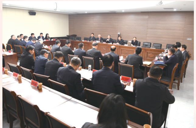
常委会组成人员分组审议相关事项