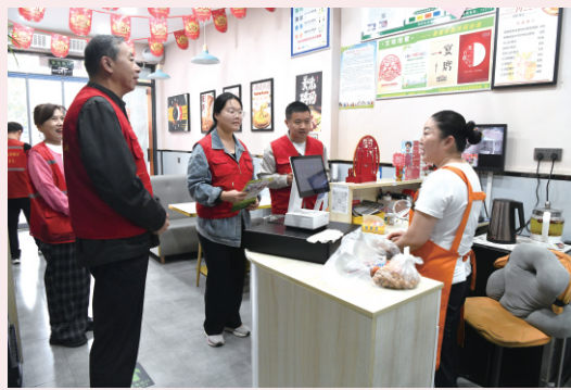
10月18日，市人大常委会机关到社区开展 践行社会主义核心价值观进商户宣传诚信活动