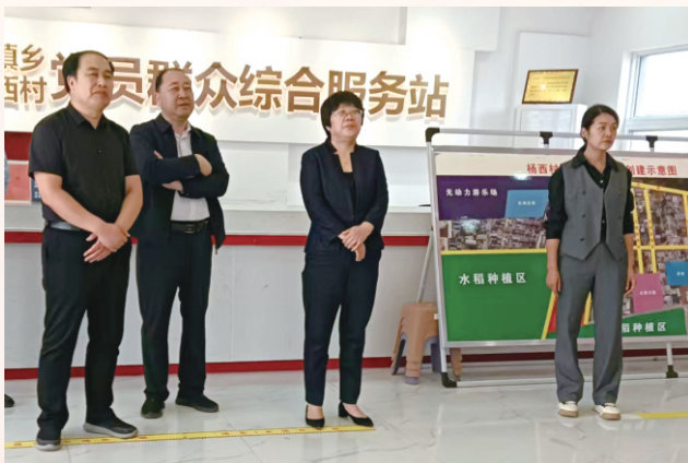
10月16日，市人大常委会副主任李玉洁 带队调研全市民族工作情况