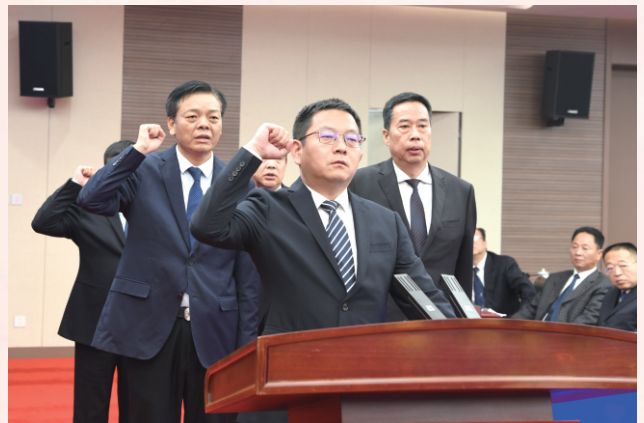
新任命国家机关工作人员进行宪法宣誓