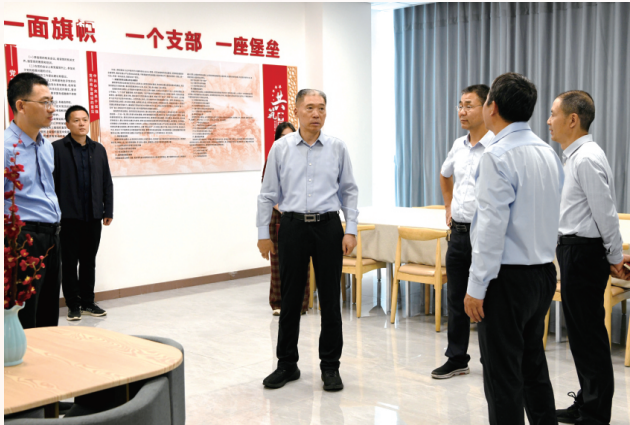
10月14日，市人大常委会主任张明新 视察机关党支部建设情况