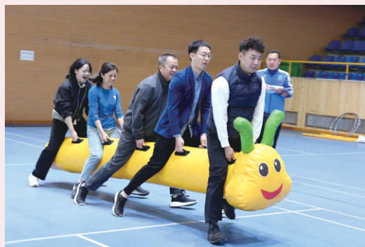
10月25日，市人大常委会机关举办趣味运动会