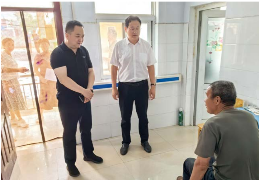
市人大常委会副主任夏磊带队到宜阳县开展养老服务联动监督检查

“要以打造洛阳人大监督工作‘样板工程’标准开展此项工作，以监督实效促养老服务高质量发展。”日前，市人大常委会党组会议听取全市养老服务联动监督情况的汇报，要求以清单式监督推动我市养老服务工作实现新提升、再上新台阶。