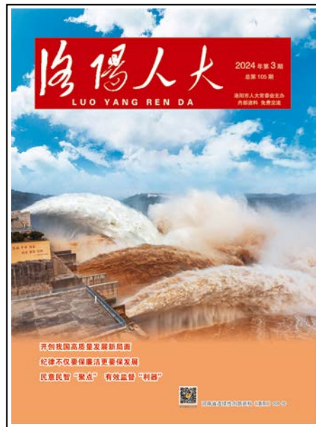
封面图片：河南省洛阳市小浪底水利枢纽调水调沙