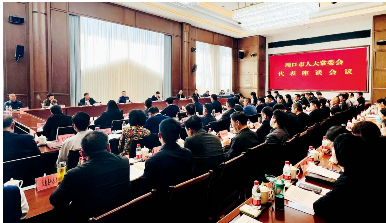
周口市人大常委会召开代表座谈会

所谓“两下两上”，指的是人大代表座谈会的制度流程：每个单月，围绕年初市人代会上政府工作报告、计划报告、预算报告、法检“两院”工作报告确定的目标任务和省人大交办工作、全市中心工作、重大项目、重要民生事项等重点工作，通过两次向人大代表征求意见、两次汇总筛选，组织人大代表召开座谈会，听取和办理代表提出的意见、建议。具体而言，每单月月初，市人大常委会各工委围绕当前全市重点工作提出初步议题，向7个市级专业代表小组和232个代表联络站征求意见；市人大各专门委员会研究讨论代表意见、对议题进行修正，让议题更贴合群众意愿、更符合发展实际，提交领