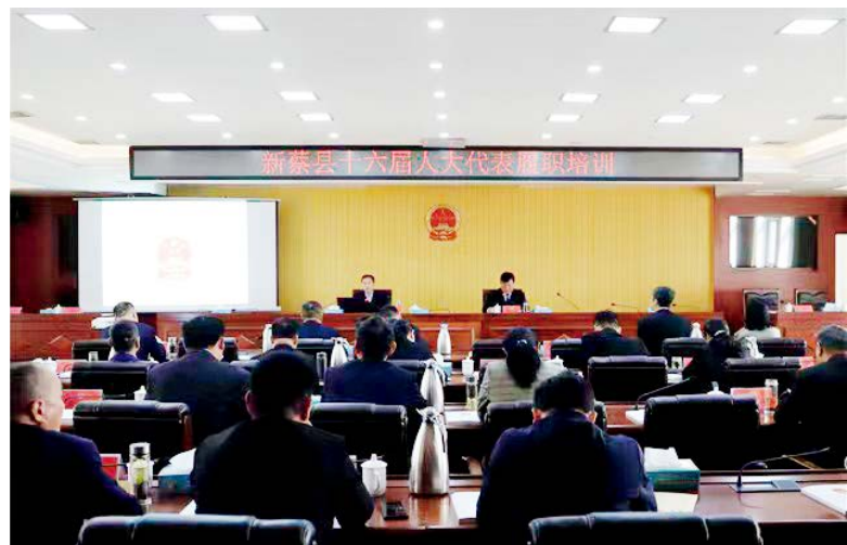
新蔡县人大常委会开展县十六届人大代表履职培训

强化政治理论学习。 坚持以开展“主任讲堂”为引领、机关常态化集中学习为重点、个人自学为辅助，强化理论武装，深化主题教育成果，持之以