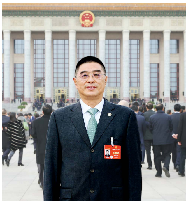
全国人大代表、万华禾香生态科技股份有限公司董事长郭兴田

但是，以草代木是一场跨化学、产线设备、工艺研究的革命。2005年，郭兴田在北京市昌平区成立了第一个秸秆板研究所，以小麦秸秆和无醛添加胶黏剂为原料，经过6个月的研发，终于做出了第一张从形态、物理结构、强度到环保等各方面都不