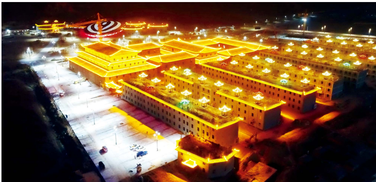
函谷关老子文化养生园夜景

习近平总书记指出：“中国共产党从成立之日起，既是中国先进文化的积极引领者和践行者，又是中华优秀传统文化的忠实传承者和弘扬者。”中华