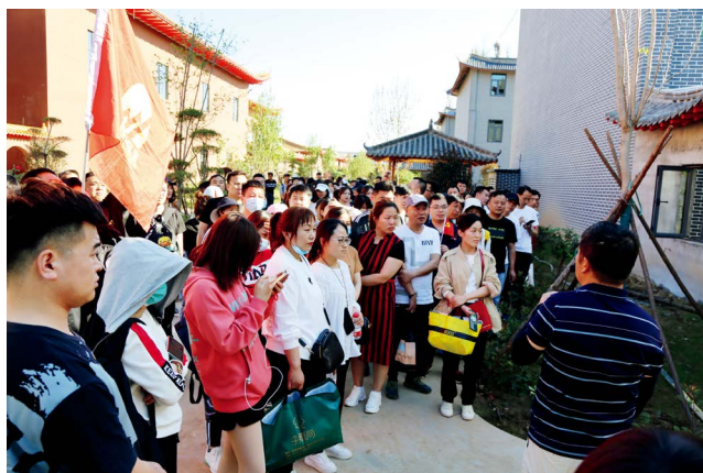
鑫山党委在函谷关党建文化交流中心开展“学党史 强党性 当先锋”——“永远跟党走”群众性体验活动

优秀传统文化是党的建设的“肥沃土壤”，党的建设扎根于这个“肥沃土壤”才能生根开花，才能汲取丰富的养分并茁壮成长。