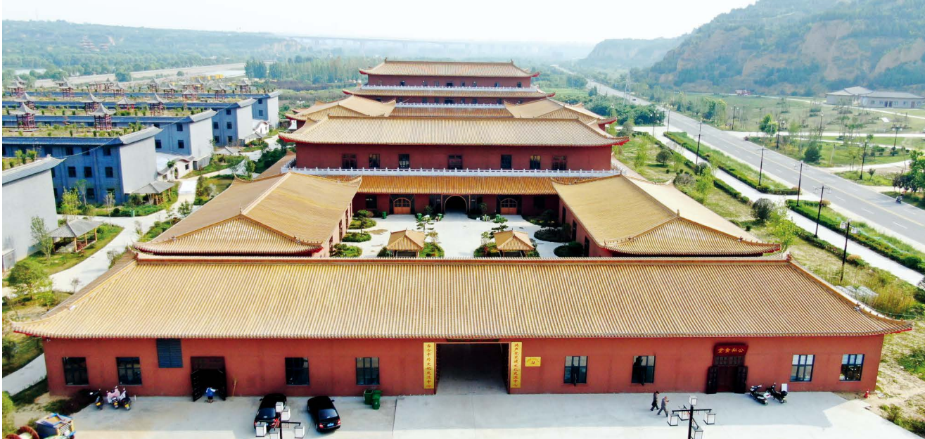
函谷关党建文化交流中心

国之交，在于民相亲；民相亲，在于心相通。中华优秀传统文化是世界了解中国的一扇窗户，以老子文化为核心的优秀传统文化是中华五千年文明的重要承载者。函谷关更是中华优秀传统文化的汇聚地。未来，河南鑫山实业将一如既往地肩负起传承、弘扬中华优秀传统文化的责任担当，通过开展形式多样的国际文化交流研讨活动，把以老子文化为核心的中华优秀传统文化“请进来、带回去、走出去”，推动中华优秀传统文化交流互动、创造性转化、创新性发展，讲好中国故事。👉