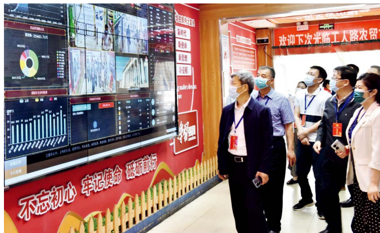
郑州市中原区人大常委会主任薛晓军带队视察工人路农贸市场智慧大数据中心

有效提升人大代表履职能力。通过定期寄发学习资料、召开政情通报会等途径，向人大代表介绍人大工作动态和区情、社情；采取专题讲座、以会代训、履职交流等形式，增强代表培训工作实效。2022年7月和9月，分别邀请全国人大常委会资格审查委员会和郑州市人大常委会的专家对新当选的人大代表进行履职能力提升培训。健全代表履职激励约束机制，组织代表签订履职承诺书，完善代表履职登记制度，印发代表手册，开展代表向选民述职并接受评议，增强履职实效。