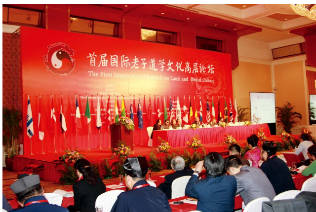
首届国际老子道学文化高层论坛