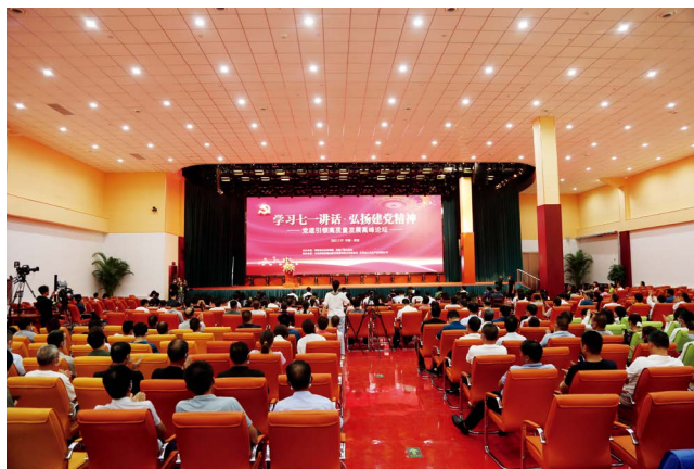
党建引领高质量发展高峰论坛在函谷关党建文化交流中心举行

中国共产党百年的伟大实践诠释了为人民谋幸福、为中华民族谋复兴的初心和使命。在鑫山，“进取的空间、开放的平台、公众的利益、社会的企业”是企业的宗旨，也是企业的初心。河南鑫山实业如