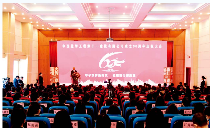
公司60周年庆典大会