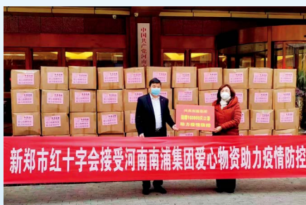
南浦集团捐赠爱心物资助力疫情防控