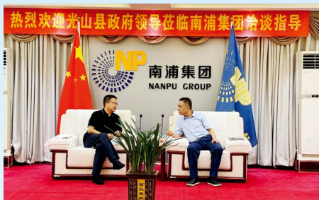
中共光山县委书记王建平到南浦集团调研并听取公司董事长秦新伟汇报企业发展情况