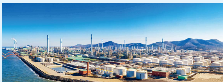
公司承建的大连恒力石化污水处理装置