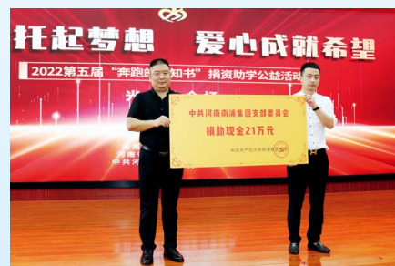
南浦集团党支部为困难大学生捐赠助学金