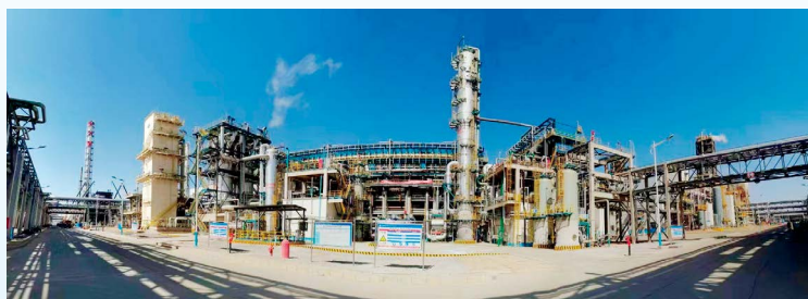
公司承建的中煤鄂能化甲醇项目