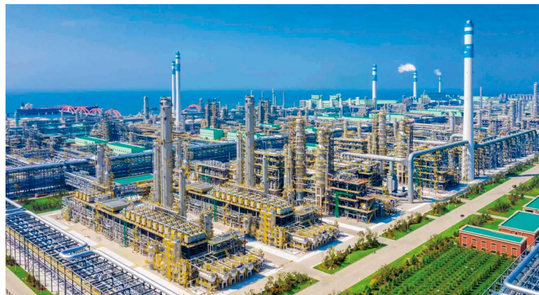
公司承建的大连恒力石化炼化主装置

从二十世纪九十年代开始，十一化建在国内外市场开发取得骄人业绩。国内业务辐射西北、东北、华北、华南、中原等多个地区，涵盖国内七大世界级石化产业基地及四大现代煤化工产业示范