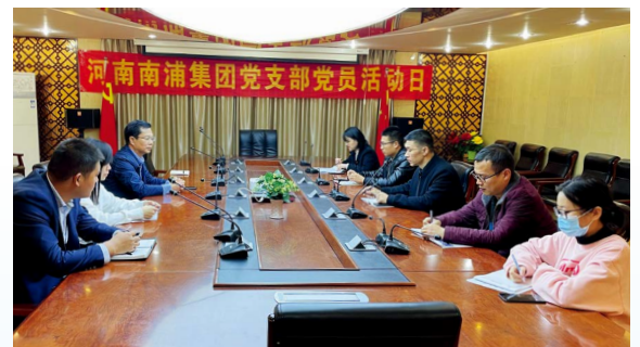
南浦集团党支部党员活动日