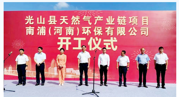
南浦（河南）环保有限公司天然气产业链项目开工仪式

南浦（河南）环保有限公司天然气产业链项目位于光山县官渡河产业集聚区，一期液化天然气工厂采用国内先进技术创新，拟建成300万吨/年（分为两期建设，每期150万吨/年）及基础配套工程，用于调峰储能汽运外送等；二期拟建设年产5000吨碳纳米管，主要用于碳纳米级芯片的原材料、锂电池导电浆料、太阳能电池涂层、高强度结构材料、催化剂载体、电磁屏蔽材料等领域；三期主要生产具有高附加值产品以及国家级新型能源先进材料。