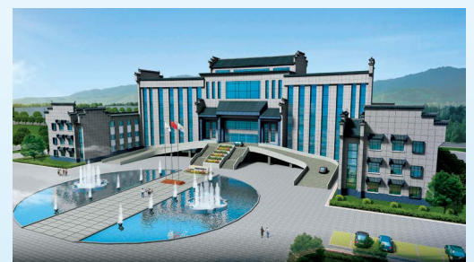
河南南浦环保科技有限公司办公楼