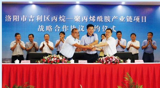
南浦集团与洛阳市吉利区政府、洛阳炼化公司签订战略合作协议