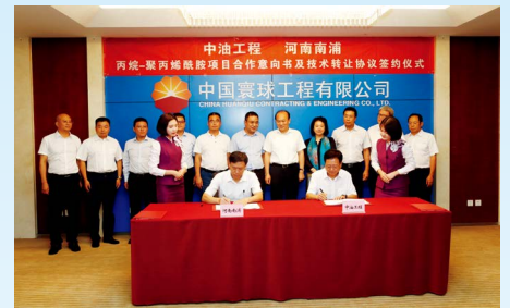
南浦集团与中油工程签订合作意向书及技术转让协议