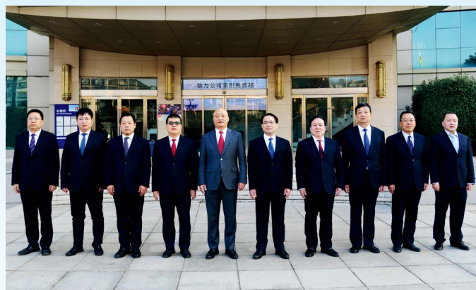
团结奋进的公司领导班子

作为全国高新技术企业，十一化建始终把科技创新、科技兴企作为持续发展的源动力，坚持以国家级企业技术中心为龙头，以博士后科研工作站、河南省石油化工安装工程技术中心为纽带，细分领域差异化发展的科研组织体系，在大件吊装、大型机组安装、特殊材质焊接等多个方面保持国内领先，获得国家、省部级科技进步奖数十项和国家专利285项，取得国家级工法5项、省部级工法45项、科技创新成果奖28项，获得“中国建筑工程鲁班奖”“国家优质工程金奖”“国家优质工程奖”“中国建筑业企业500强”“全国五一劳动奖状企业”“全国实施卓越绩效模式先进企业”“全国先进建筑企业”“全国用户满意施工企业”“全国守合同重信用企业”“全国安康杯竞赛示范单位”“中国石油和化工行业技术创新示范企业”“河南省知识产权优势企业”等300余项荣誉称号。