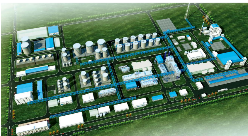
南浦集团“丙烷-聚丙烯酰胺项目”厂区效果图

南浦集团将继续坚持以习近平新时代中国特色社会主义思想为指导，深入学习贯彻党的二十大精神，践行初心使命，以“引领产业生态，共创智慧环保”为使命，坚持“诚信务实、团结协作、艰苦奋斗、成就客户、回报社会”的核心价值观，坚持以化工产业为抓手，充分发挥自身优势、深挖内部潜力，推动产业优化升级，持续推进各大业务板块协同发展，以激发区域经济活力为己任，努力打造多元化的产业实业集团，为地方经济作出积极贡献，为河南产业结构的转型升级添砖加瓦，为加快建设以实体经济为支撑的现代化产业体系作出更大贡献。👉