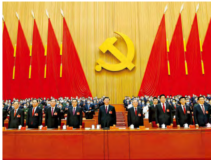
10月22日，中国共产党第二十次全国代表大会在北京人民大会堂胜利闭幕。这是习近平、李克强、栗战书、汪洋、王沪宁、赵乐际、韩正、王岐山、胡锦涛在主席台上。