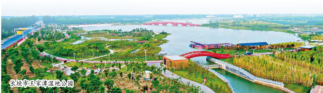
长垣市王家滩湿地公园