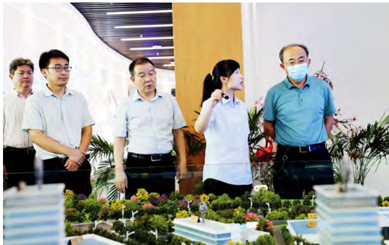
洛阳市人大常委会主任吴中阳到涧西区调研并帮助企业解决困难

进万家门，把党的惠民政策、洛阳发展建设的成效、市委的工作思路和目标等送到千家万户和中小微企业，帮助群众理思路、增信心、提干劲；知万家情，围绕群众关注的热点问题、基层久拖未决的老旧问题、制约产业发展的难点问题，采取“面对面”“背靠背”等方式，察实情、找问题、听意见；解万家忧，大力营造“活商、亲商、安商、便商”的浓厚氛围，深入田间地头、项目一线，助力解决好