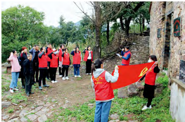
涪池县人大常委会机关组织开展红色主题教育活动

读书月、读书日活动，定期为干部职工赠送书籍，结合常委会各委室工作职能，成立读书兴趣小组，开展丰富多彩的读书活动，充分发挥人大图书室的“文化粮仓”功能，常态化开展“日读一文、周荐一书、月办一会（读书交流会）、一季一讲堂”活动，适时举办亲子读书会、经典朗诵会、读书成果展，开展读书明星、书香科室、书香家庭评选活动，引导人大干部职工通过“线上+线下”多种方式积极学习新理论、新知识、新技能，不断拓宽视野、创新思维、丰富内涵，全面锻造善读书、勤学习、精思考的人大干部队伍，着力培植主题鲜明、内涵丰富、特色突出的人大机关文化。