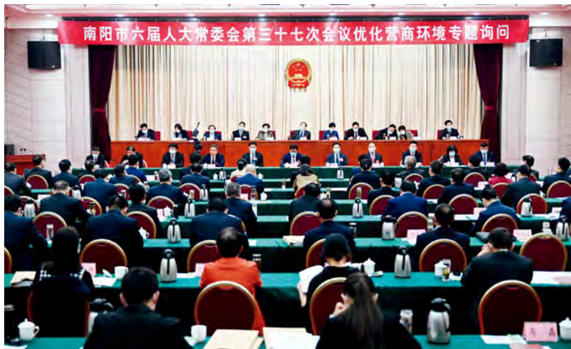
南阳市六届人大常委会第三十七次会议开展优化营商环境专题询问

法治是最好的营商环境。近年，南阳市人大常委会针对本地创新引领效应不明显、市场主体满意度不高、部分项目要素制约明显、行政执法缺少温度等营商环境工作中存在的现实问题，围绕打造“六最”营商环境的工作目标，持续将优化营商环境纳入重点监督内容，打出“专题视察+专项报告+专题询问+专项测评+网络直播”的监督“组合拳”，通过