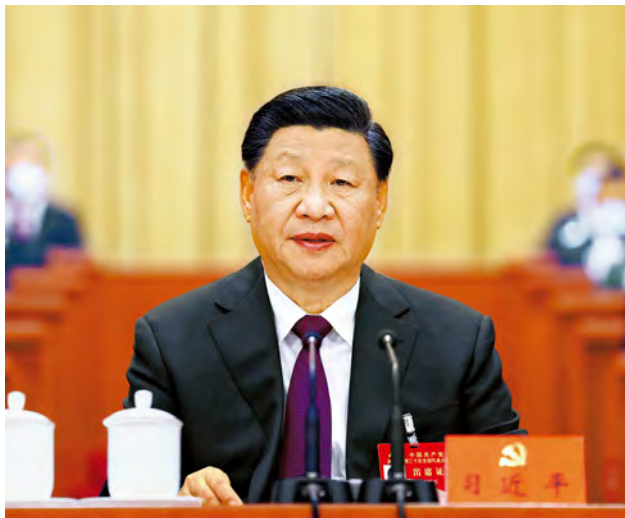
10月22日，中国共产党第二十次全国代表大会在北京人民大会堂胜利闭幕。习近平同志主持大会。

习近平强调，中国共产党走过了百年奋斗历程，又踏上了新的赶考之路。一百年来，党团结带领全国各族人民取得了新民主主义革命、社会主义革命和建设、改革开放和社会主义现代化建设的伟大胜利，开创了中国特色社会主义新时代。百年成就无比辉煌，百年大党风华正茂。我们完全有信心有能力在新时代新征程创造令世人刮目相看的新的更大奇迹。全党要紧密团结在党中央周围，高举中国特色社会主义伟大旗帜，坚定历史自信，增强历史主动，敢于斗争、敢于胜利，埋头苦干、锐意进取，团结带领全国各族人民为实现党的二十大确定的目标任务而奋斗