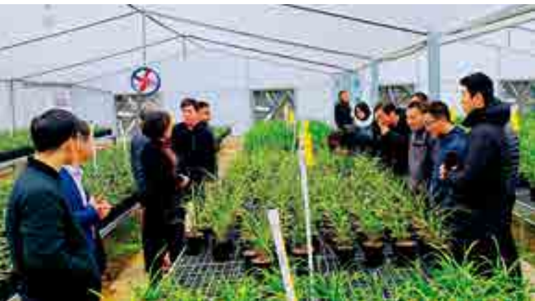
人大代表视察罗山县灵山镇惟馨花卉产业园

截至目前，罗山县人大常委会组织常委会组成人员集中开展走访群众活动，已形成“我为群众办实事”重点民生项目27个和重点民生问题72个，让3个平台由单纯接收办理群众意见建议向主动对标明确目标任务转变，并量化指标、压实推进，确保做则必成、做就做好，真正让广大群众切实感受到高质量发展、高品质生活、高效能治理的实践成果。↓