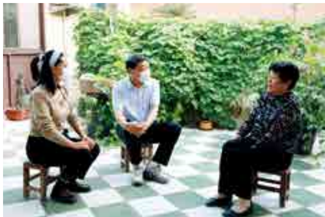
人大代表进村入户收集民情民意

民生实事项目人大代表票决制是实现民生实事项目由政府“自己定、自己干”向“人民定、政府办”转变的重要举措，能够推动解决群众最关心、最直接、最现实的民生问题，真正实现民生连着民心，让群众得到实实在在的好处。赵堡镇组织代表进行民生实事项目全过程征集和全覆盖审议决定，在镇十六届人大二次会议上票决出2022年度民生实事项目4个，并组织代表开展全链条跟踪监督、全方位绩效评价和满意度测评，推动群众“急难愁盼”的民生实事落地见效。