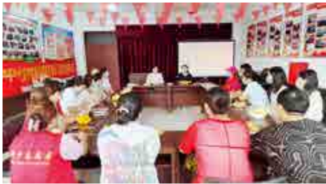
新乡市红旗区向阳街道人大代表联络站组织人大代表、志愿者、社区群众召开座谈会

作为倾听民声、了解民情、广纳民意、汇聚民智的重要载体，“掌上联络站”包括人大代表手机端和后台电脑端两部分。手机端显示“滚动屏、最新通知、我的名片、我的履职、我的监督、我的报告、学习园地”七大板块。系统后台对各项内容进行实时