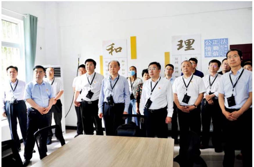
安阳市人大常委会副主任张保香带队深入文峰区查看社区建设情况

社区治理是基层治理的重要组成部分。在新冠肺炎疫情防控中，社区是联防联控的第一线，也是外防输入、内防扩散最基础的防线。2020年年初新冠肺炎疫情的发生对基层社会治理提出新