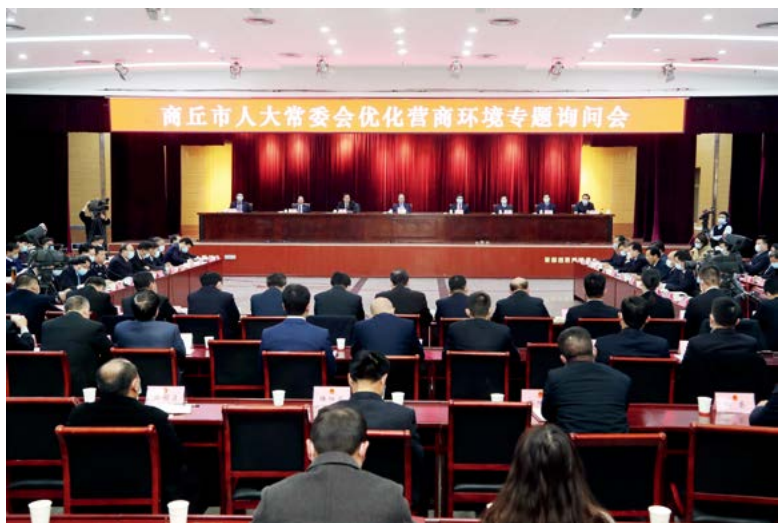
商丘市人大常委会优化营商环境专题询问会