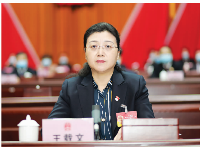
市委副书记、市政协主席王载文主持第三次大会