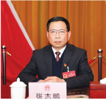
市人大常委会副主任 张志鹏