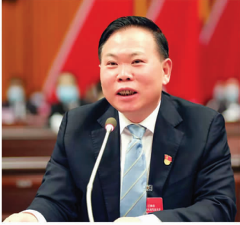
市委书记、市人大常委会主任 刘南昌