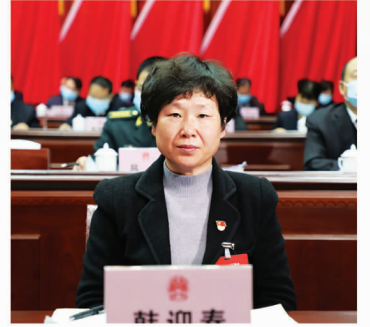
市人大常委会副主任 韩迎春