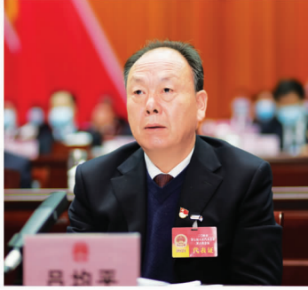
市人大常委会副主任 吕均平