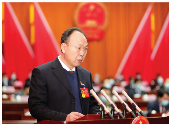
市人大常委会副主任吕均平作市人大常委会工作报告