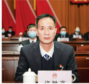
市人大常委会副主任 许胜高