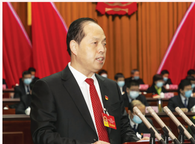
市长安伟作市人民政府工作报告