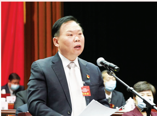
市委书记、市人大常委会主任刘南昌出席会议并讲话