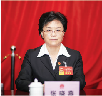
市人大常委会副主任 张晓燕