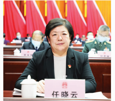
市人大常委会秘书长 任晓云