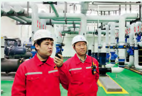
清洁取暖运维人员正在调水调压作业