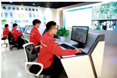
万江新能源集团清洁热力云控中心