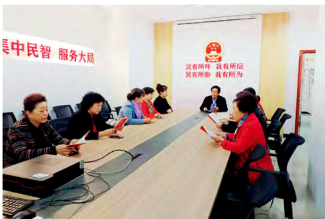
济源市玉泉街道联络中心站开展人大代表领学宪法活动