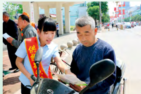
鹿邑城区清洁供暖知识宣传周