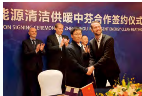
中芬能源合作助力“郑州智慧能源清洁供暖”