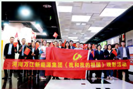
万江新能源集团开展员工党建活动