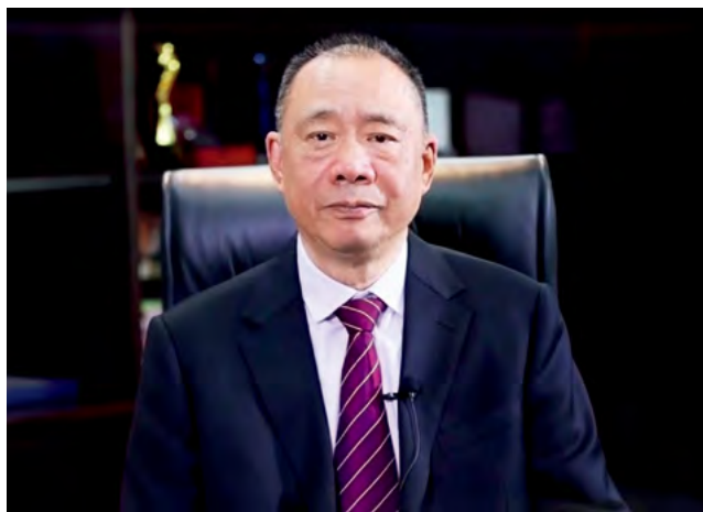
第十届、第十一届、第十二届全国人大代表，全国工商联农业产业商会名誉会长，三全食品创始人、万江新能源集团董事长陈泽民

1987年，陈泽民已是郑州市第二人民医院副院长。要解决孩子将来结婚、住房等问题，单靠他每个月130元的工资是不行的。陈泽民就向邻居借了1.5万元开起冷饮部，主要卖蛋筒冰淇淋。为纪念十一届三中全会的召开，他给冷饮部起名“三全”。