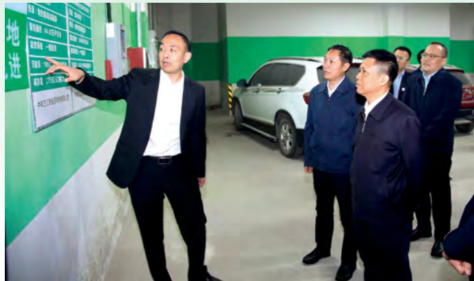
国家能源局总经济师郭智考察万江清洁供暖项目

大力推动“四化”（热源清洁化、服务人性化、控制智慧化、建设跨区化）建设、打造一流清洁供暖品牌是万江新能源集团一直坚持的发展思路；家里温暖如春、窗外蓝天白云是万江人始终担在肩上的使命和重任。万江新能源集团将继续坚持居民优先、清洁优先、环保优先、生态优先、补充优先、创新优先的原则，以人民对美好生活的追求和向往为不懈奋斗的目标，为“碳中和、碳达峰”工作作出更大的贡献。