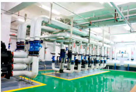
万江新能源集团现代化地热能供暖站房