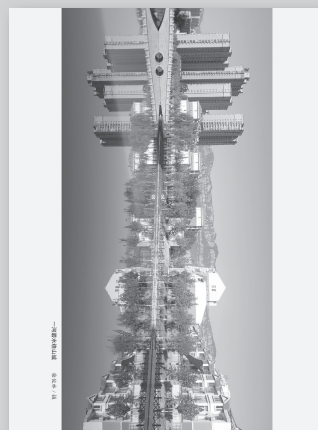
一河碧水绕山城