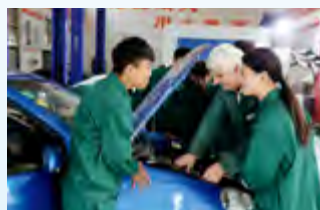
中德汽车技术培训中心