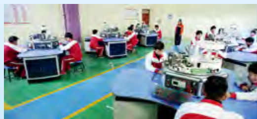
机电一体化实训室