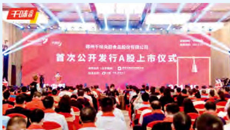
公司首次公开发行A股上市仪式