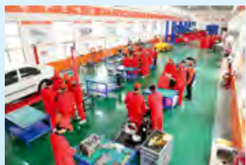
汽车技术实训基地