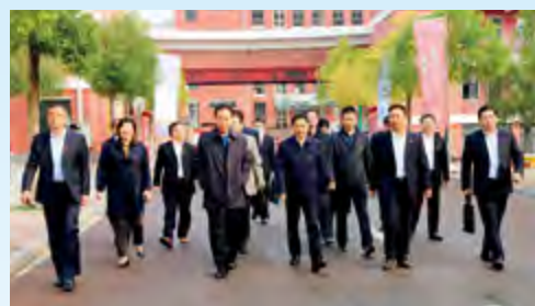
2020年10月30日，河南省工业和信息化厅党组书记、厅长李涛莅临学院指导工作。

郑州工业技师学院坚持立德树人，践行“真诚做人，用心做事”的校训，团结严谨，务实进取，传承发扬“大国工匠”精神，以学生为中心、能力本位、就业导向，打造“六好”（招生好、就业好、管理好、培训好、教学好、服务好）学校，建成全省一流、全国知名品牌技师学院，为河南乃至全国培养更多、更好的高技能人才，服务和促进经济社会发展。