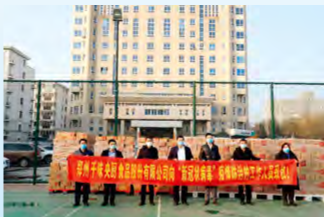
公司向参加疫情防控的工作人员致敬