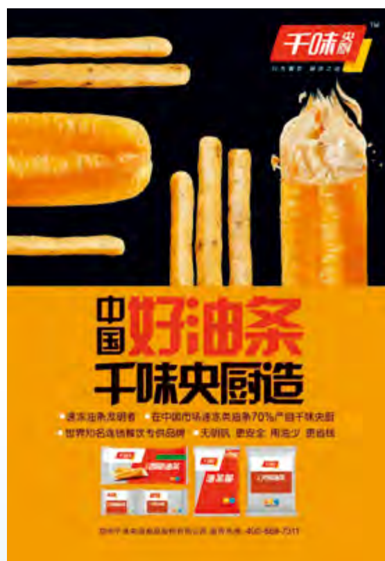
千味央厨产量最大品类——油条

千味央厨以大型连锁餐饮企业为主要目标客户，已成为肯德基、必胜客、东方既白、小肥羊、真功夫、呷哺呷哺、德克士、华莱士等知名餐饮品牌的半成品供应商，还是肯德基的最高级别T1供应商。千味央厨将秉承“服务、创新、开放”的经营理念，不断开拓创新，持续为中国餐饮业提供更优的服务保障。