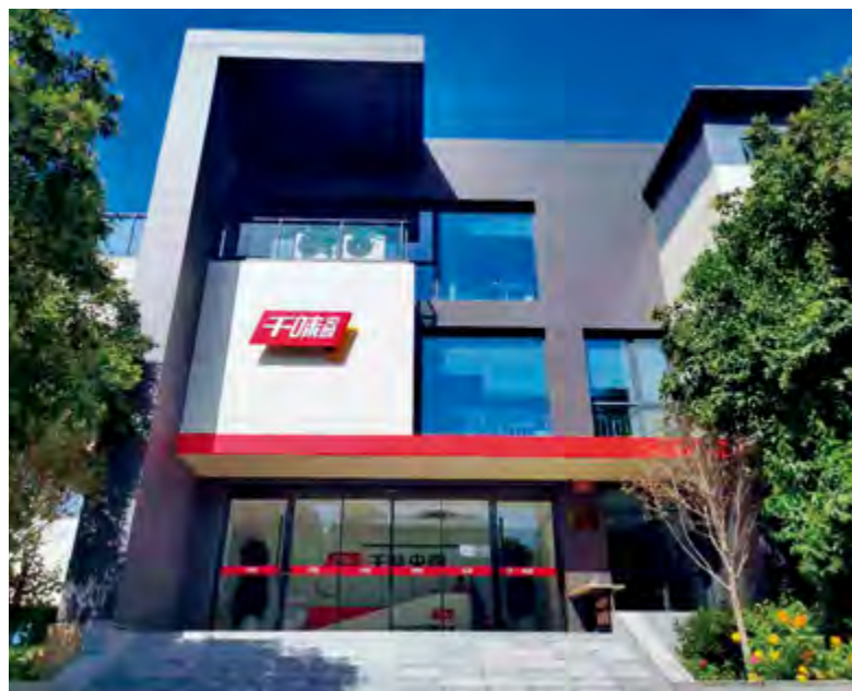
千味央厨郑州总部

公司已通过ISO9001国际质量管理体系认证、FSSC22000食品体系安全认证、危害分析与关键控