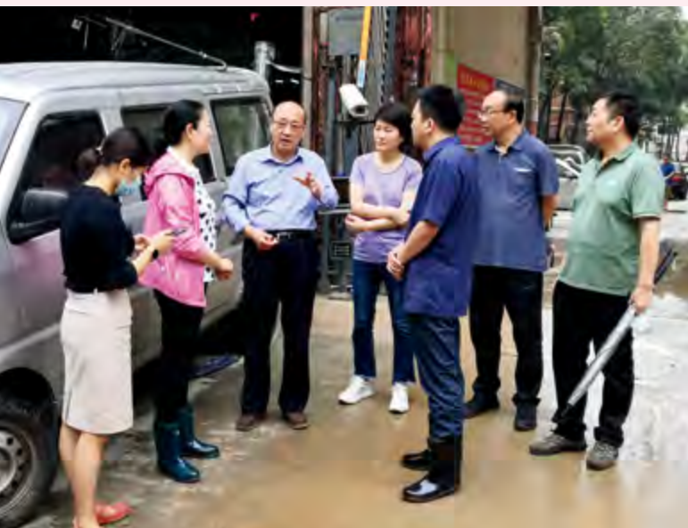
郑州市人大常委会主任胡荃督导防汛救灾工作

区健康隐患。在社区工作人员的带领下，下沉志愿党员干部深入人民路街道的9个社区楼院，分发矿泉水900箱、方便面411箱。市人大常委会机关的志愿者向76户80岁以上的孤寡老人和行动不便的困难家庭开展了“送物资上门”活动。大家提着矿泉水和方便面，爬7层甚至30多层楼梯发放救灾物资，让受灾困难群众真切感受到党和政府的关怀和温暖。经多方组织，市人大常委会机关为人民路街道的受灾群众送来5车价值10多万元的慰问物资，积极协调中型发电机2台、抽水泵8台、铲车5台次、运输车辆10台次。机关党员干部职工踊跃捐款17.45万元，并向奋战在抢险救灾一线的工作人员送去矿泉水100箱。