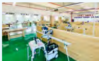
第46届世界技能大赛郑州市选拔赛木工集训基地